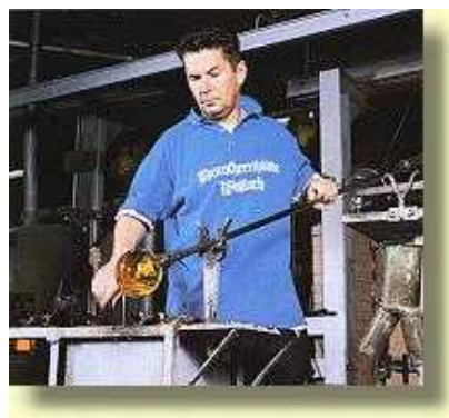
Dorotheenhütte Museum über Glasbläserei bei Wolfach