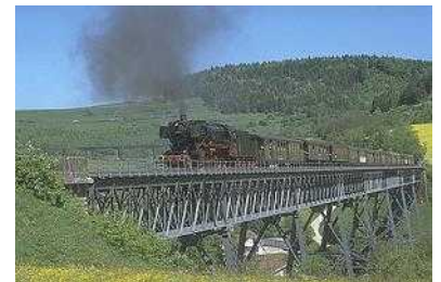
Sauschwänzlebahn (Museumsbahn) bei Blumberg, 40km