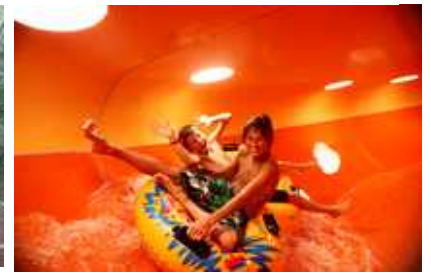
Schwarzwaldpark (Wild- und Freizeitpark) bei Löffingen, ca. 25 km.